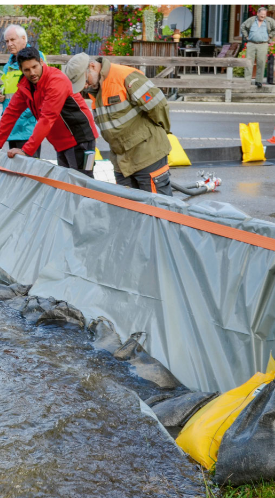
Foto rechts: Anhand eines konkreten Beispiels besprechen die Kursteilnehmenden organisationsübergreifend die organisierte und geplante Evakuierung eines Gebietes.

Foto links: Der mobile Hochwasserschutz weist das Wasser ab: rechts die klassische Bauweise mit Paletten, Bauplastik und davor Sandsäcken; links die rot-weißen, mit Wasser gefüllten Kunststoff-Dammelemente von der Firma Aeschlimann Hochwasserschutz AG.